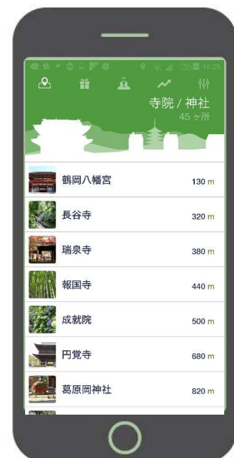
【図2】観光地への行き先候補